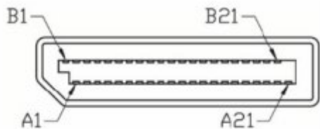
SFF-8612 OCuLink pinout (Output)